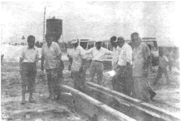
△ 图为领导同志在辛河路扩展△ 工程施工现场视察。